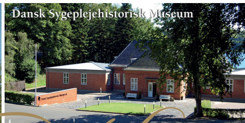
Dansk Sygeplejehistorisk Museum